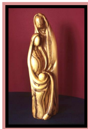
Heilige Familie aus Olivenholz →